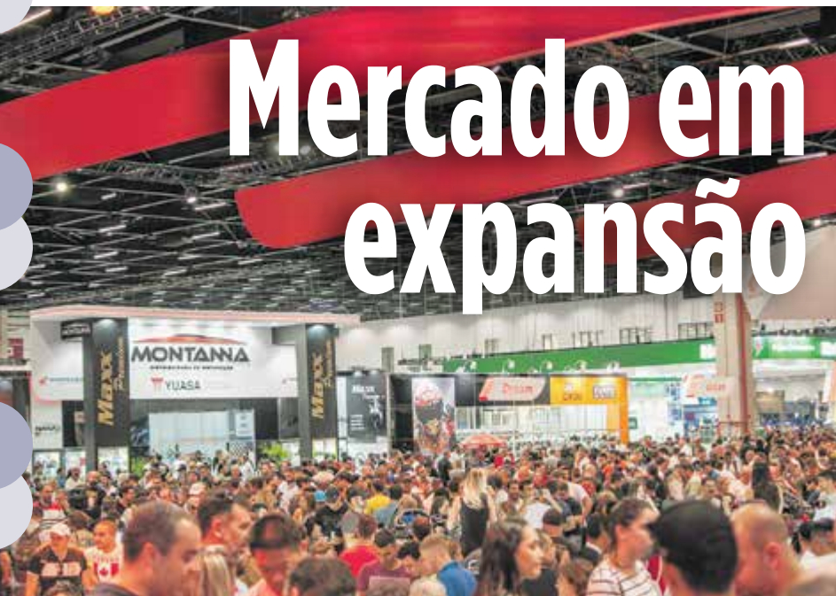
Público no Salão Duas Rodas 2017